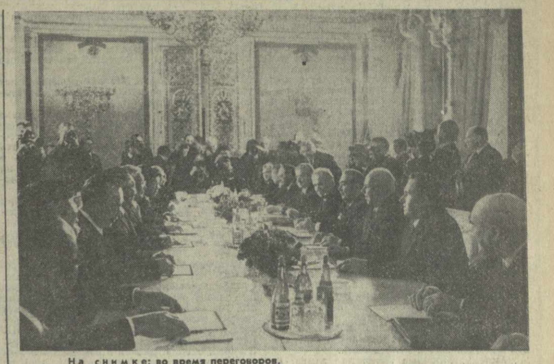
На снимке: во время переговоров.

19 октября в Кремле состоялась дружеская беседа Генерального секретаря Центрального Комитета КПСС Л. И. Брежнева с Первым секретарем Центрального Комитета МНРП, Председателем Президиума Великого Народного хурала МНР Ю. Цеденбалом. Товарищи Л. И. Брежнев и Ю. Цеденбал обсудили вопросы дальнейшего углубления всестороннего сотрудничества между СССР и МНР, расширения связей между КПСС и МНРП. Было подчеркнуто, что единство взглядов и действий советских и монгольских коммунистов является определяющим фактором укрепления традиционного союза СССР и МНР, сближения двух братских народов. В ходе встречи состоялся обмен мнениями о положении в коммунистическом и рабочем движении. Руководители обеих партий подтвердили, что КПСС и МНРП исполнены решимости и впредь всемерно содействовать сплочению коммунистического движения на принципах марксизма-ленинизма и пролетарского интернационализма. Рассмотрев международные проблемы, имеющие важное значение для углубления международной безопасности и развития сотрудничества между государствами, Л. И. Брежнев и Ю. Цеденбал отметили насущную необходимость принятия действенных мер по ограничению и прекращению гонимого вооружений и распространению процесса разрядки на все районы мира. Встреча прошла в обстановке сердечности, дружбы и полного единства взглядов по всем обсуждавшимся вопросам. (ТАСС).