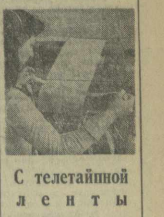
С телетайпной ленты