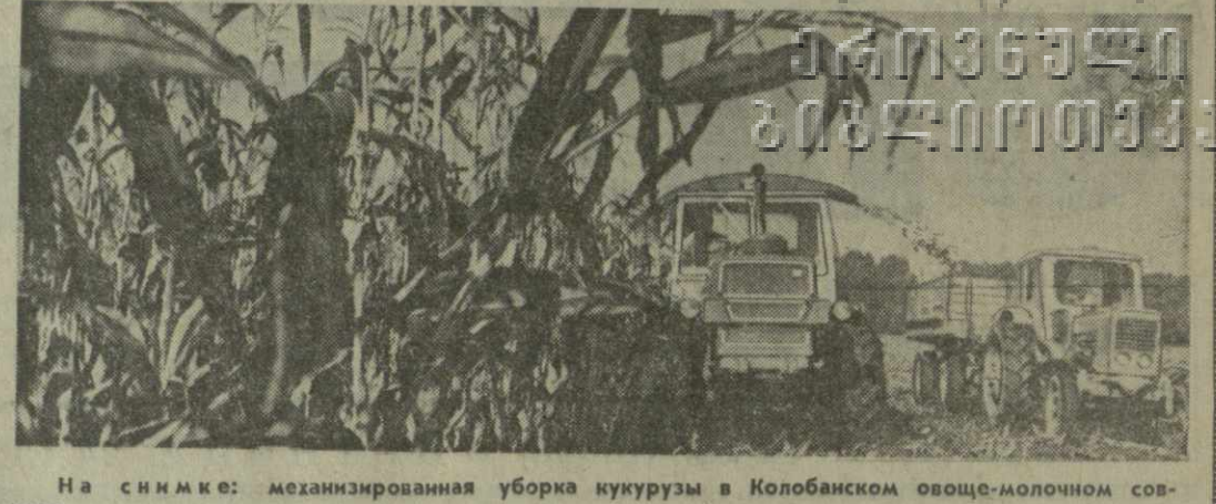
На снимке: механизированная уборка кукурузы в Колобанском овоще-молочном совхозе.