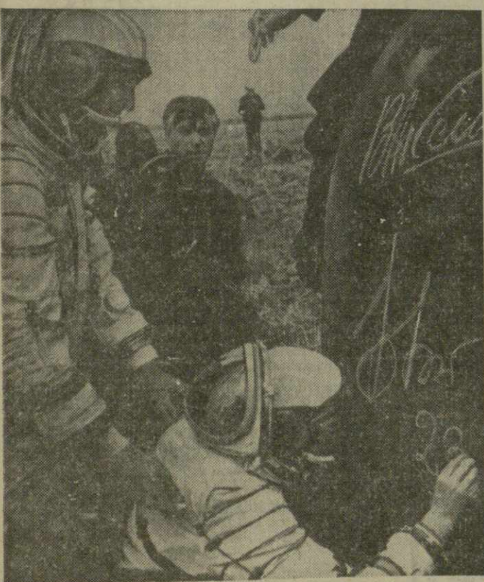
На снимке: В. Быковский [справа] и В. Аksenov оставили автографы на спускаемом аппарате после приземления. (Телефото ТАСС — ГрузинФОРМ).

В авангарде социалистического соревнования горняков уверенно идут коллективы тубилульской шахты имени Ленина, тиварчельских шахт имени Ленина и имени 50-летия СССР.