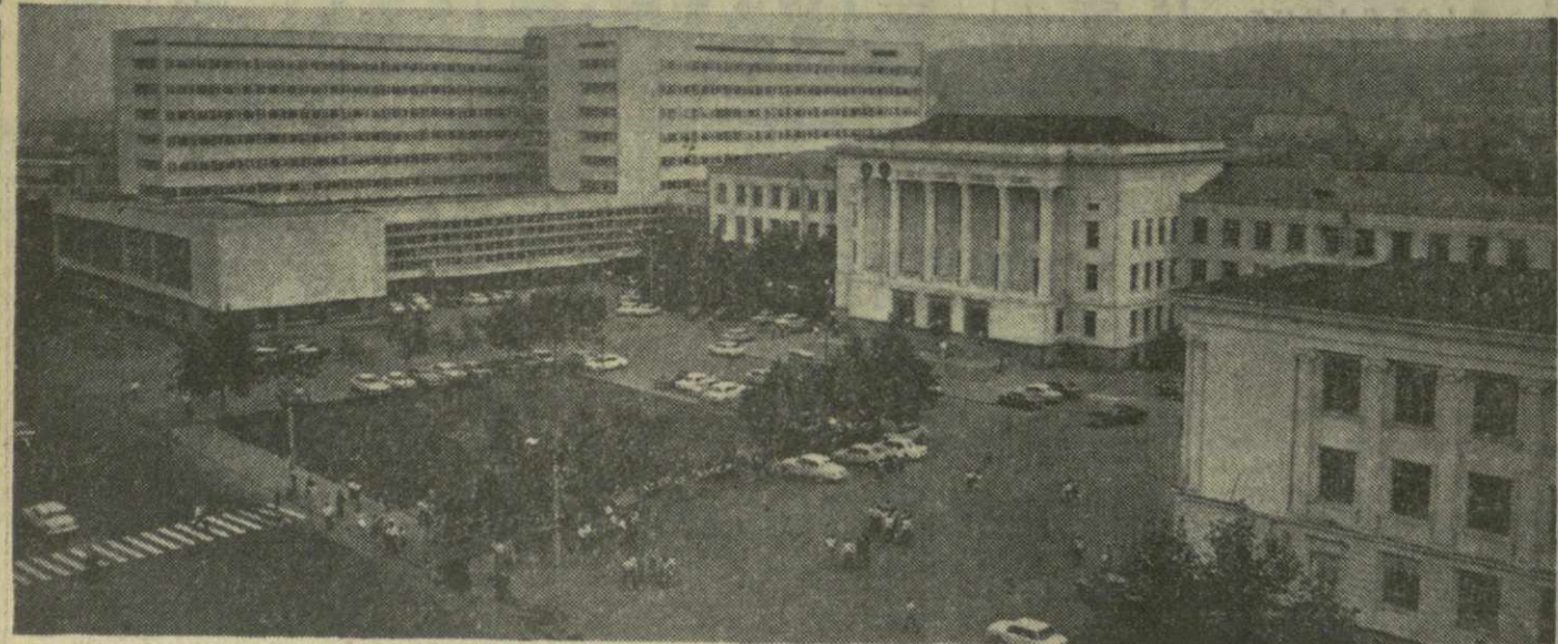
На снимке: корпуса Грузинского государственного политехнического института.