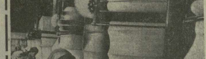
▲ КНДР. По производству тканей социалистическая Корея опережает многие страны Азии. Только один Пхеньянский текстильный комбинат, построенный с помощью Советского Союза, выпускает в год свыше ста миллионов метров различных тканей.