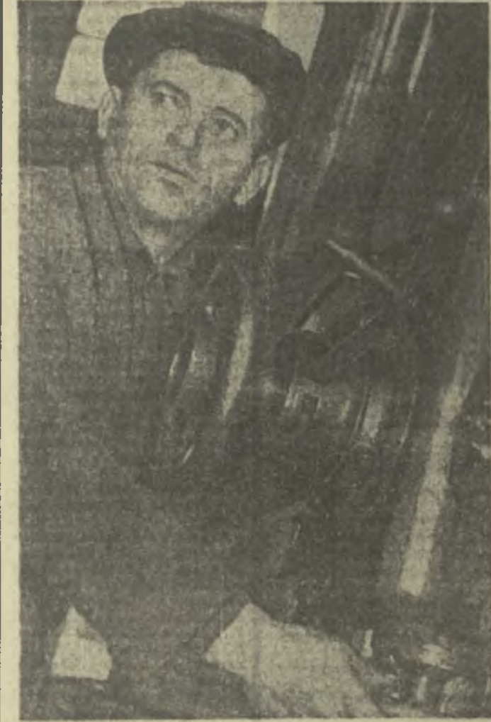
Совершенствовать методы партийного просвещения

Сотрудники Республиканской агрохимической лаборатории имени Пранишвили закончили составление картограмм почв колхозов и совхозов Махарадзевского района. Агрохимические картограммы уже составлены для хозяйства 28 административных районов общей площадью 530 тысяч гектаров. В этом году в 113 колхозах и совхозах, на экспериментальных базах научно-исследовательских институтов и сельскохозяйственных техникумов будут проведены полевые опыты, и в конкретных условиях уточнены потребности почв в минеральных удобрениях. Составление агрохимических картограмм для всех хозяйств республики будет завершено к началу 1968 года.