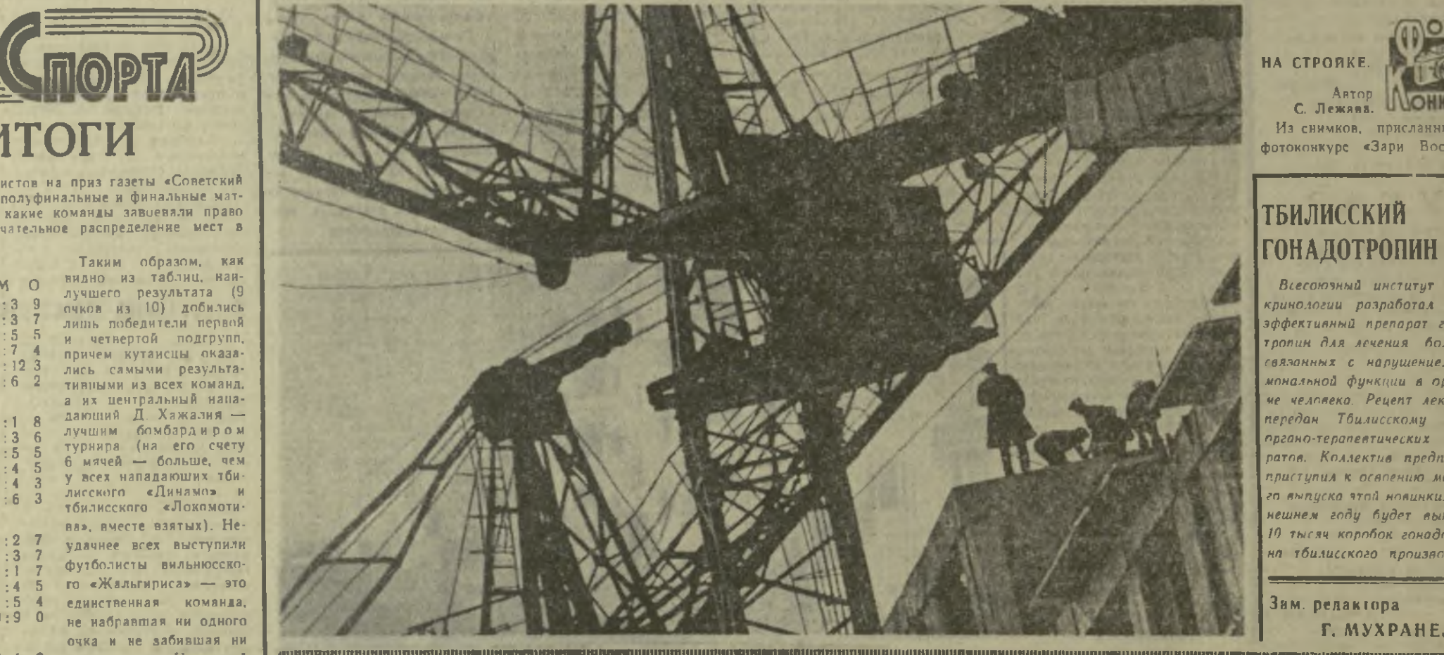
НА СТРОЙКЕ. Из снимков, присланных на фотоконкурс «Заря Востока».