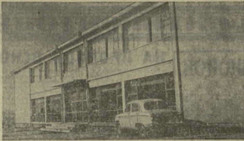
Замечательный подарок по случаю юбилейного года Советской власти...