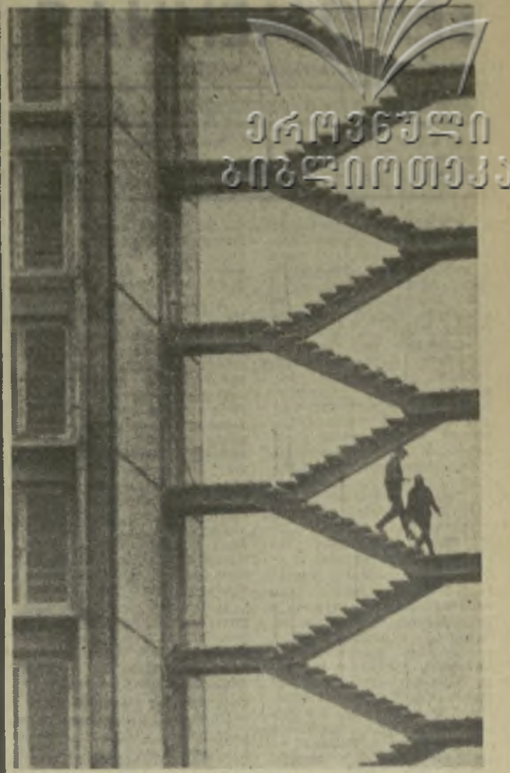
ЭТАЖИ ПЯТИЛЕТКИ. Автор — С. Киадзе. Из снимков, присланных на фотоконкурс «Заря Востока».

БОНН. (ТАСС). Объединение западногерманских профсоюзов вновь выступило с требованием запрещения неонацистской национальной демократической партии. Правление объединения призвало политические партии, представленные в западногерманском бундестаге, принять меры для запрещения национальной демократической партии.