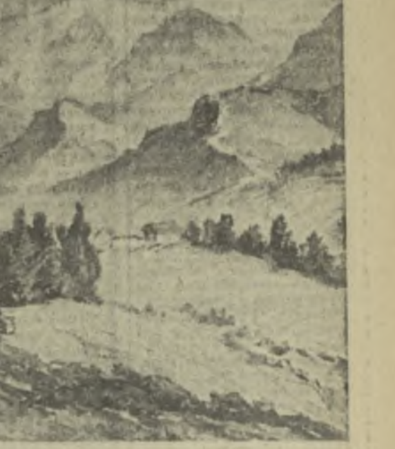
Горы, покрытые вечными снегами, образуют «Землю в облаках» работы Е. Мухоминой. «Село Анапс» — пейзаж работы Е. Мухоминой. Кинкоде, влетевший по настроению Е. Дигурова-Кинкоде много ездит по республике, запечатлел на своих картинах живописные уголки Грузии. Пейзаж «Село Анапс» (репродукция с картины — внизу) — одна из многих работ грузинских художников, которые будут представлены на выставке, посвященной Международному женскому дню 8 Марта, открывающейся сегодня в клубе художников.