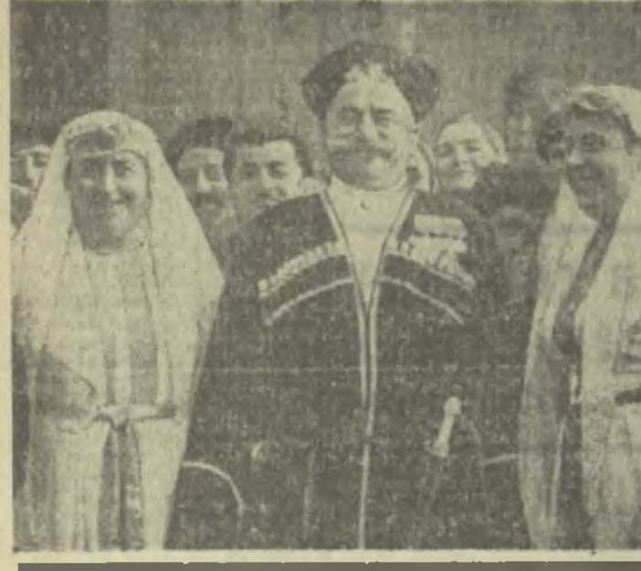
Поездом «Руставели» приехали в Тбилиси колхозники и рабочие, врачи, ученые, педагоги...

Вчера, в первый весенний день, на проспекте Важа Пшавела были высажены тридцать пять саженцев яблонь. Бережно укутанные, они были привезены гостями—туристами из ласнежского Адигенского района.