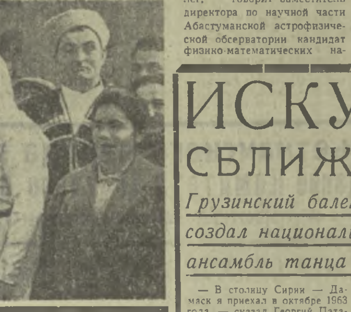
Наши люди живут в достатке. Работники фермы получают от 150 до 200 рублей в месяц...

Ученые, педагоги... Они с интересом осмотрели достопримечательности города, познакомившись с новостройками, побывали в метро.