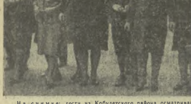
На снимке: гости из Кобулетского района осматривают один из уголков г. Тбилиси.