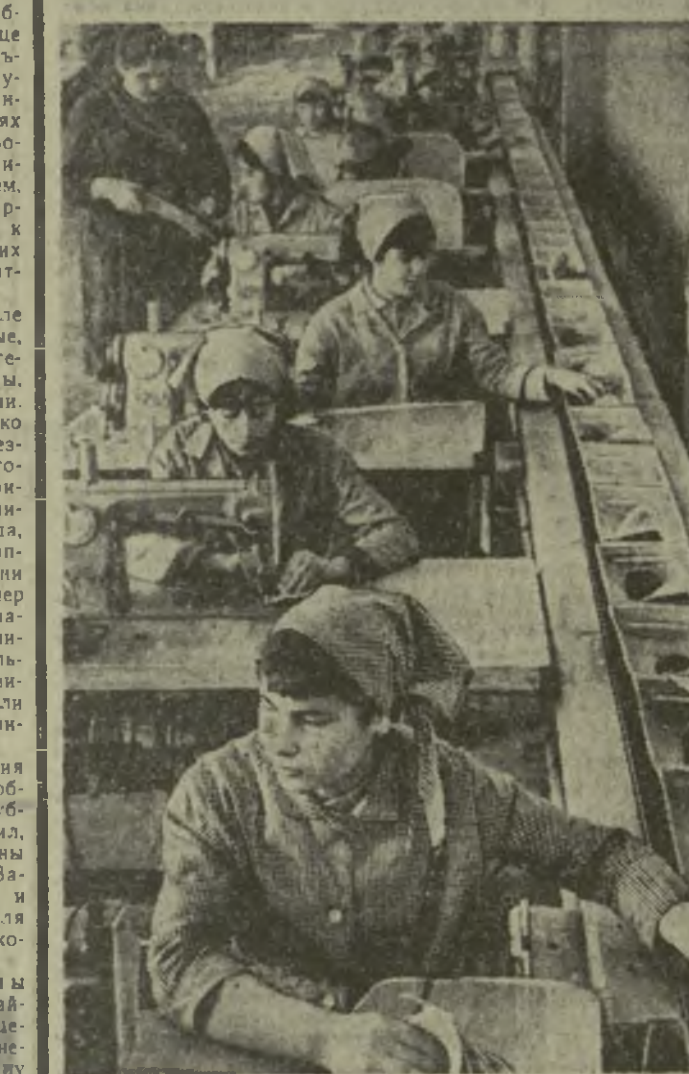
С 1930 года в Тбилиси при обувной фабрике № 1 «Исаи» работает профтехучилище № 27. За время своего существования училище выпустило 4 600 специалистов обувной промышленности, которые сейчас успешно трудятся на обувных предприятиях нашей республики. Недавно училище получило новое здание с благоустроенными кабинетами, мастерскими. На снимке: идет занятые в мастерской по пошиву обуви.