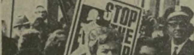
США. На снимке: участники организации «Женщины борются за мир»...