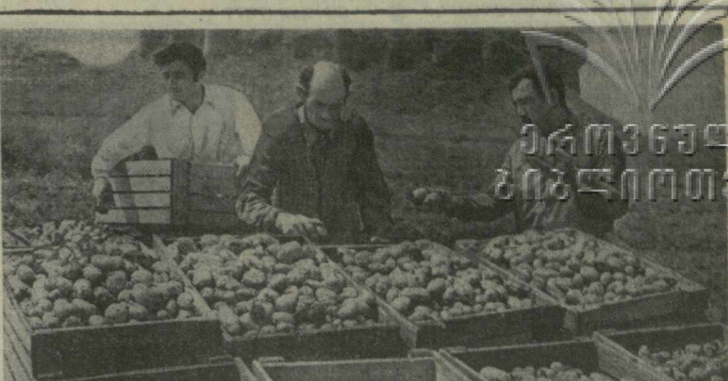
ЗЕМЛЯ И ЛЮДИ: ВЕСЕННИЕ ЗАБОТЫ

ზარია ვოსტოკა საქართველოს საბჭოთაო კომუნისტური პარტიის ცენტრალური კომიტეტის ორგანო საბჭოთა საკავშირეო პარტიის ცენტრალური კომიტეტის ორგანო