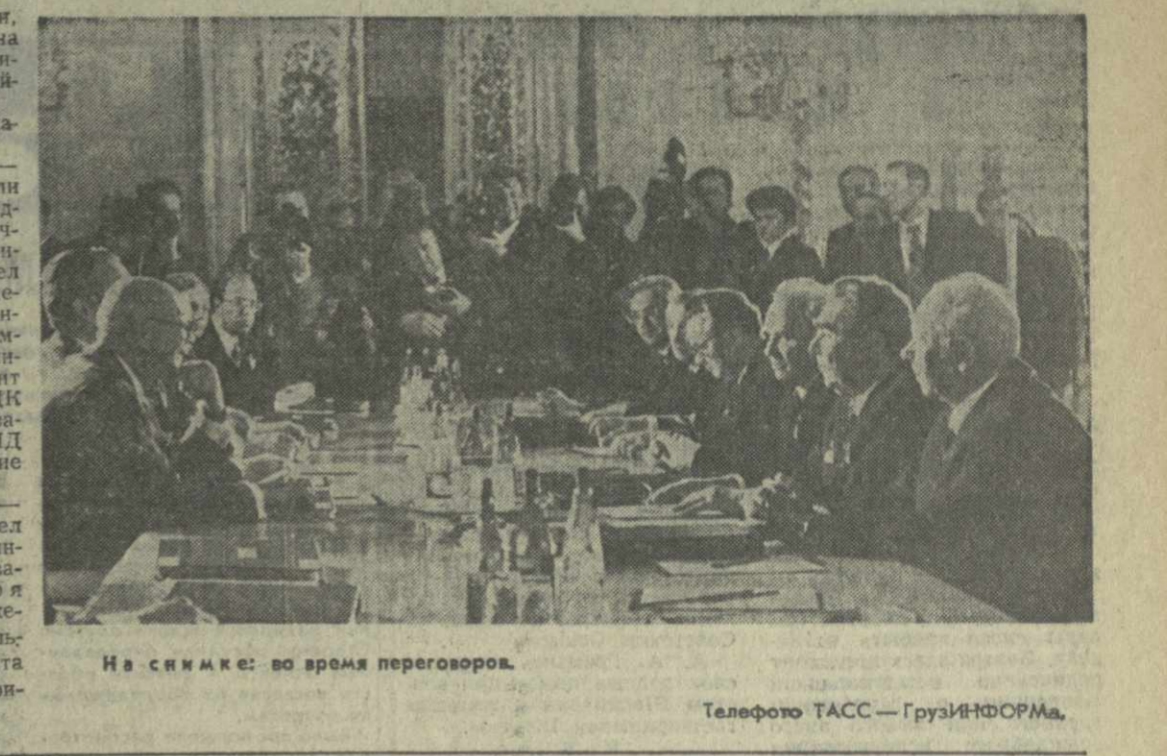
На снимке: во время переговоров.

17 мая в Кремле состоялись советско-финляндские переговоры. Переговоры вели: с советской стороны — Генеральный секретарь ЦК КПСС Л. И. Брежнев, член Политбюро ЦК КПСС, Председатель Верховного Совета СССР Н. В. Подгорный, член Политбюро ЦК КПСС, Председатель Совета Министров СССР А. Н. Косыгин; с финляндской стороны — Президент Финляндской Республики Урхо Калева Кекконен. В ходе переговоров, проходивших в дружественной обстановке и в духе взаимопонимания, состоялся восторженный обмен мнениями по широкому кругу вопросов советско-финляндских отношений. Участники переговоров с удовлетворением констатировали, что добрососедские отношения двух стран развиваются благоприятно, их прочным фундаментом успешно продолжает служить Договор о дружбе, сотрудничестве и взаимной помощи 1948 года.