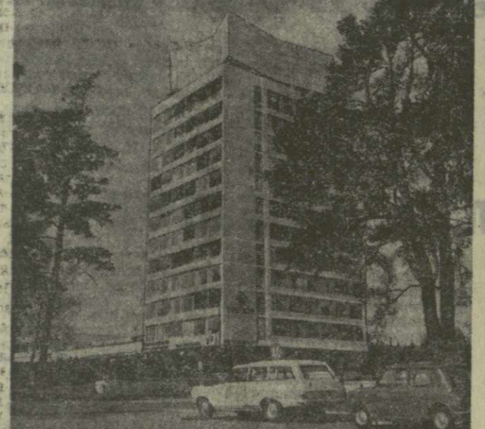
▲ ХЕЛЬСИНКИ. Административно-торговый центр города.

ДАМАСК, 17 мая. (ТАСС). Открывшаяся здесь на днях выставка работ художников Грузии привлекает большое внимание сирийской общественности. На ней представлены полотна грузинских мастеров живописи самого разнообразного жанра. Сирийские специалисты дают высокую оценку искусству грузинских мастеров кисти, отмечая художественный реализм, глубокую содержательность и гуманизм их работ, высокое профессиональное мастерство. Выставка вызвала живой интерес среди жителей Дамаска. Идя навстречу их пожеланиям, устроители решили продлить ее еще на несколько дней. С творчеством мастеров живописи Советской Грузии затем познакомится также жители Алеппо, Латакии и других крупнейших городов Сирии.