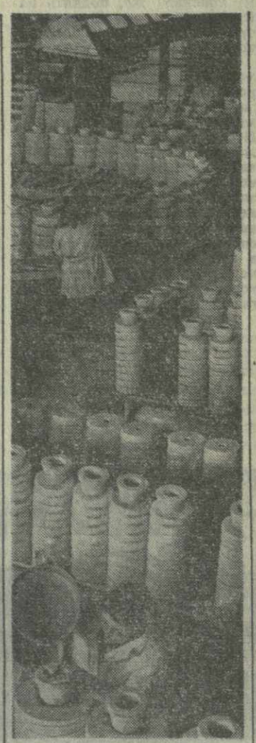
▲ ИЗЯЩНЫЕ, с оригинальными рисунками, чайники, тарелки, салатники, солонки выпускает коллектив Звудского фарфорового завода.

На снимке: фарфоровый цех.