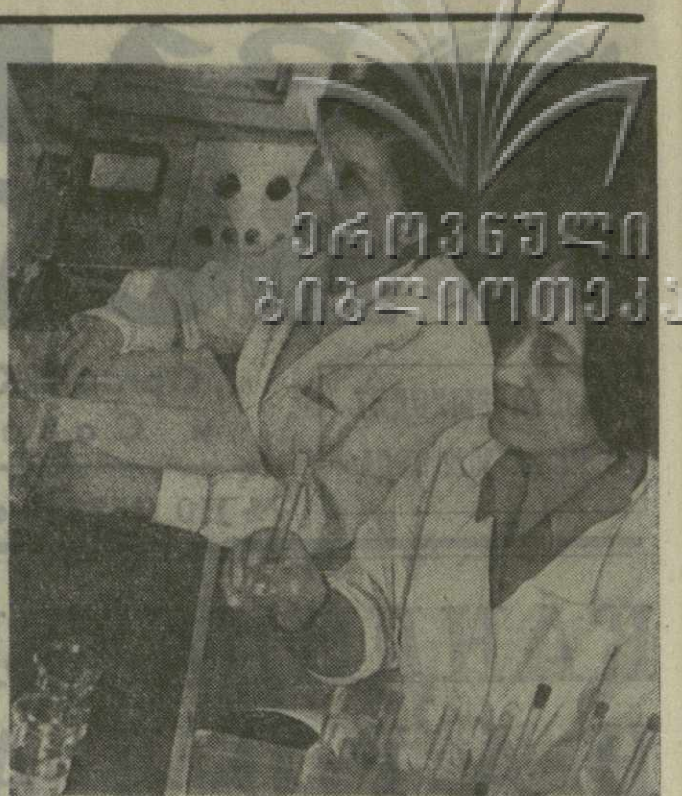
▲ СОВРЕМЕННАЯ ГЕОЛОГИЯ требует от ученых и исследователей всестороннего изучения состава строения пород и минералов. С этой целью в Институте геологии Академии наук Грузинской ССР недавно оборудована лаборатория, оснащенная современными приборами по атомно-абсорбционному и инфракрасному анализу пород и минералов.