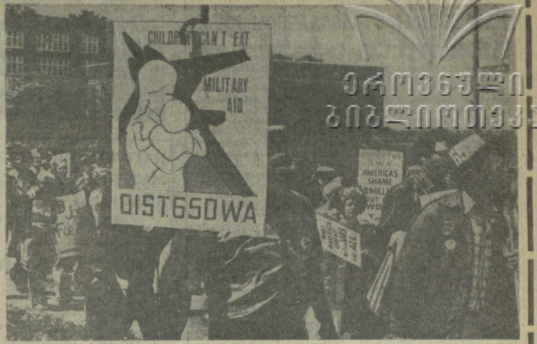
▲ МАТЕРИ АМЕРИКИ протестуют против непомерных аппетитов военно-промышленного комплекса США, против гонки вооружений, стремления Пентагона навязать простым людям Америки пушки вместо масла. Все громче раздается голос протеста, все шире массовое движение американцев за мир, за разоружение.

взаимного уважения и территориальной целостности. Нынешние события, указывает газета, судя по всему, связаны с провокационными действиями Пекина. Поддержка пекинским руководством Кампучии в вопросе о вьетнамо-кампучийской границе не последственным образом содействует с гегемонистской политикой Китая в Юго-Восточной Азии. (ТАСС, 10 января).