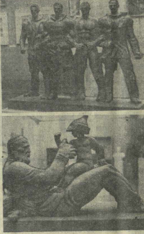
▲ С УСПЕХОМ демонстрируется в Картиной галерее Грузии выставка, посвященная 60-летию Вооруженных Сил СССР. Произведения живописи, графики, скульптуры, прикладного искусства, выполненные мастерами кисти и резца, отображают славный путь Советских Вооруженных Сил, рассказывают о героических подвигах и мирных буднях защитников Родины. Лучшие из работ художников Грузии будут отобраны для участия во Всесоюзной выставке, которая пройдет в столице нашей Родины — Москве. На снимках: работы художников А. Костанова «Свершилась», Д. Сихарулидзе «Расстрел 26 Бакинских комиссаров», А. Томашвили «Вступление Красной Армии в Тбилиси», М. Курдизани «Надежда».