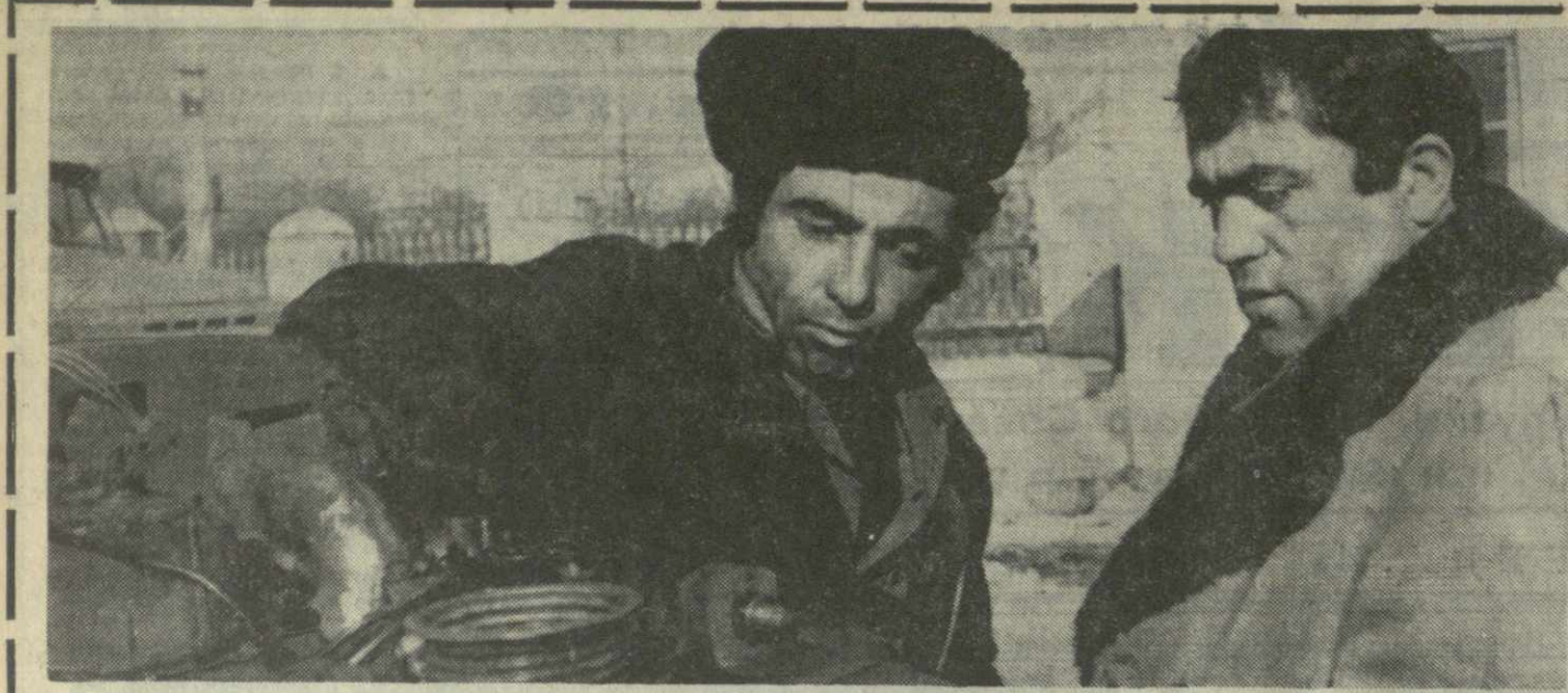
▲ НАПРЯЖЕННЫЕ ДНИ у механизаторов республики — в колхозах и совхозах, подразделениях «Грузсельхозтехники» идет ремонт сельскохозяйственной техники. Во всеоружии встретит весенние полевые работы третьего года десятой пятилетки, досрочно подготавливая всю сельскохозяйственную технику — этот призв механизаторов Галского и Цителкарского районов нашел горячий отклик у механизаторов Сагарейского виноградарского совхоза.