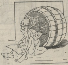
Դ Ի Օ Գ Է Լ Ը Տ Ա Կ Ա Թ Ի Ց — Լու է, որ ես Գործու՞ չեմ, թէ՛ն ես Թերթըր Խճ էլ ել Կեցառու՞նք.