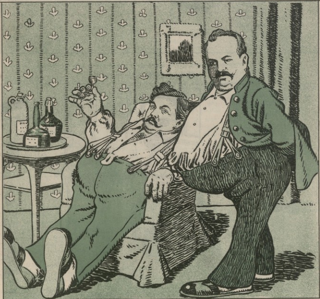
ՄԱՍԿԱՆ ԱՐԵՆՆԵՐԻ ԿԱՐՏԱՆԻՍՏԱՆԻ