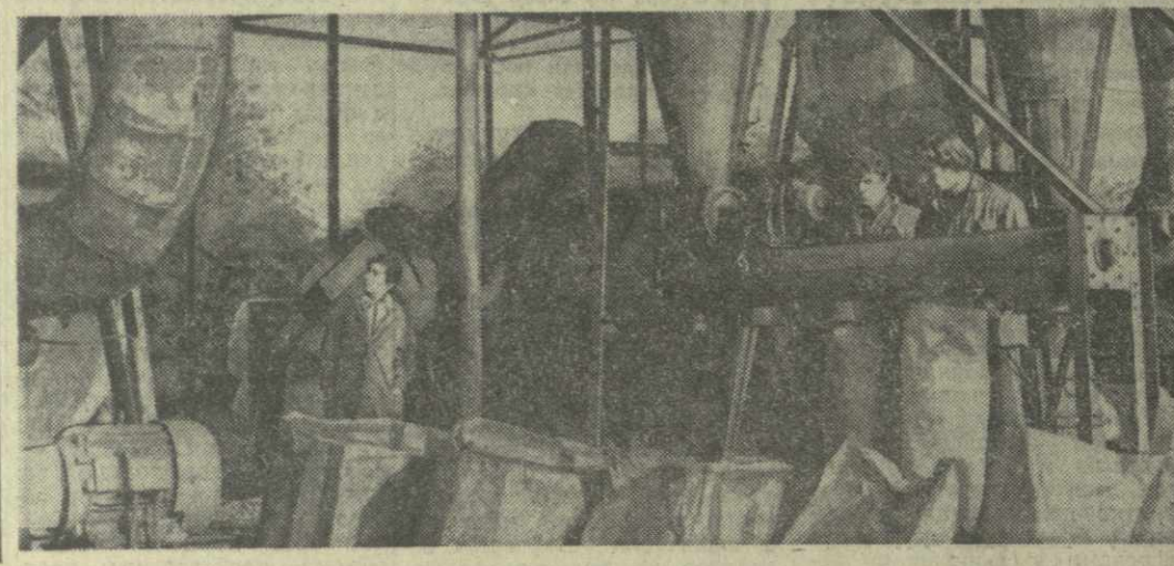
НАУКА — ПРОИЗВОДСТВУ

Президиум Совпрофа Грузии обязал всю работу профсоюзных организаций республики в ходе избирательной кампании проводить в неразрывной связи с подготовкой к празднованию 60-й годовщины Великой Октябрьской социалистической революции.