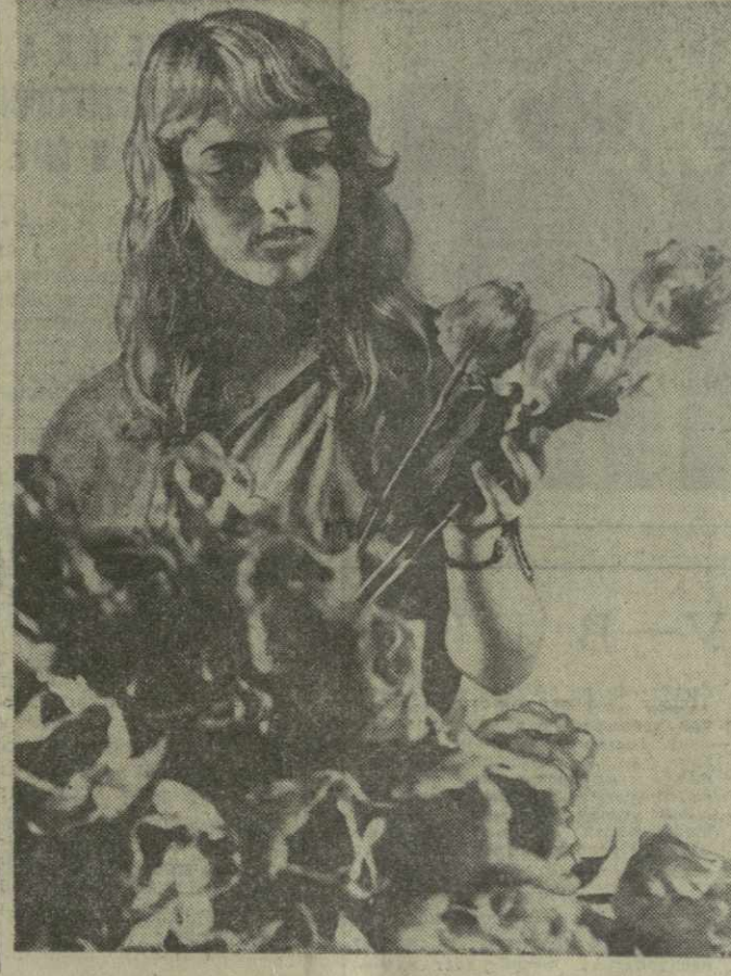
На снимке: воспитанники одного из детских садов в Улан-Баторе.

В эти дни подавлены итоги социалистического соревнования по выполнению плана развития народного хозяйства и культуры МНР в 1976 году, объявленного ЦК МНРП, Советом Министров МНР, Центральным советом монгольских профсоюзов и ЦК МРСМ. Победителям соревнования стали коллективы монголо-советского хозяйственного объединения «Монголсоветмет», Государственного полиграфического комбината, ТЭЦ Восточного Аймака и других передовых предприятий, хозяйственных организаций и учреждений культуры. Они награждены переходящими Красными знаменами и дипломами, а также получили денежные премии. Монгольскую Народную Республику называют страной юных — почти половину всего населения составляют дети. Маленькие граждане Монголии окружены постоянной заботой и вниманием партии и правительства. По постановлению ЦК МНРП и Совета Министров МНР создан детский фонд, который предназначен для строительства и благоустройства детских учреждений.