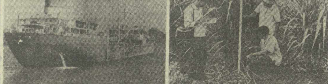
Хороший урожай сахарного тростника вырастили труженники госхоза Коинтин.

Современный торговый флот СРВ вырос за последние три-четыре года. Большую помощь в его становлении и развитии оказывает Советский Союз, который передал Вьетнаму безвозмездно несколько мор-