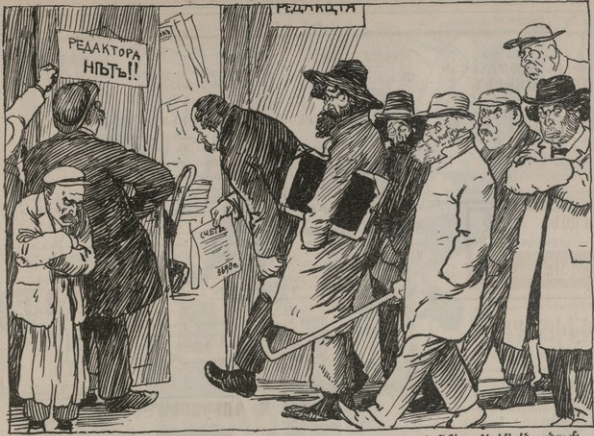
Օգոստոս, սեպտեմբեր և հոկտեմբեր ամիսներում... երբ զբաղանում էվանդիկ իրիքի են անում ՀԱՅՈՑ ԼԵՂԻ ԵՒ ԿՐՕՆԻ ՂԱՏԱՐԱՆԵՐԻ ՔՆՆՈՒԹՅԱՆԸ ՊԵՏԱԿԱՆ ՈՒՍՈՒՄՆԱԿԱՆ ՎԱՐՉՈՒԹԵԱՆ ՄԷՋ