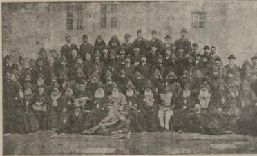
ՈՐ ԱՆՏԵԱՒ 1908 Բ. ԼՈՅՏԵՄԲԵՐԻ 1-ԻՆ ԸՆՏՐԵՑ ՎԵՂՎՈՒՄԻ Մ Ո Ւ Տ Թ Է Ո Ս Ի Չ Մ Ո Ւ Չ Մ Ի Ե Ա Ն Ի Ն Գ Ա Ք Ո Ղ Վ Ո Ս Ա Մ Ն Ի Ա Տ Է Ա Տ Յ Ո Ց