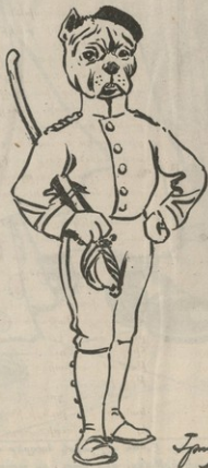
ԿՐԹԱՆ ԽՈՒՉԱՐԿՈՒ ՇՈՒՆԸ ԱՆՎՈՒՄԱՆ ԶՐԲԵՐԻ ՇԱՐՔՈՒՄ