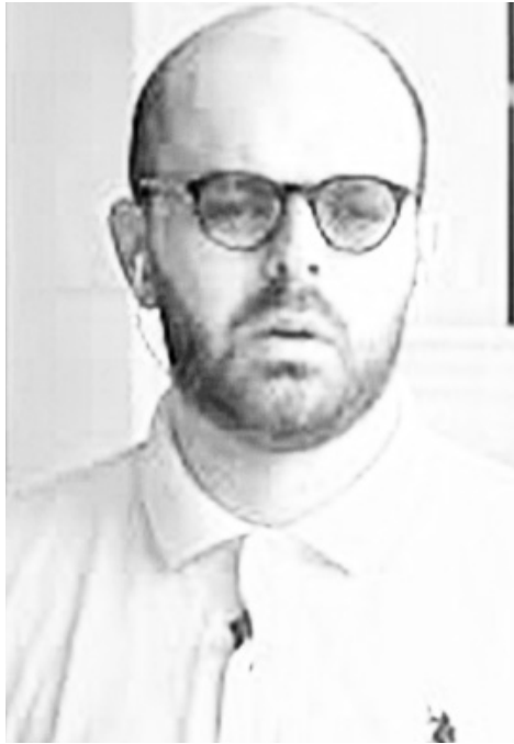
უნდა ვაჩვენოთ გაყალბების მექანიზმი.

- ჩვენთვის მთავარია, მაქსიმალური დისკომფორტი შევქმნათ „ქართულ ოცნებას“. პრეზიდენტთან ძალიან მჭიდრო კომუნიკაცია გვაქვს. იგი ქართველი ხალხის გვერდითაა წინააღმდეგობის გაწევის ბერკეტებით, რაც მას აქვს, ანუ შემაჯამებელ ოქმს და პარლამენტის უფლებამოსილებას არ ცნობს. ასევე, მთავარია უზენაეს დარღვევების ყოველდღიურად გამოუმჯადებება, დაწვერეთ ათასობა და საჩივარი (იგი ყველა ოქმში დაიწერა) და ამის საშუალებით გამოტანა ჩვენი მთავარი ამოცანაა, ანუ საზოგადოებას კიდევ ერთხელ