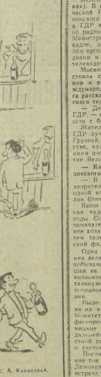
НАШЕЛ ВЫХОД ИЗ ПОЛОЖЕНИЯ. Рис А. Каналаки.