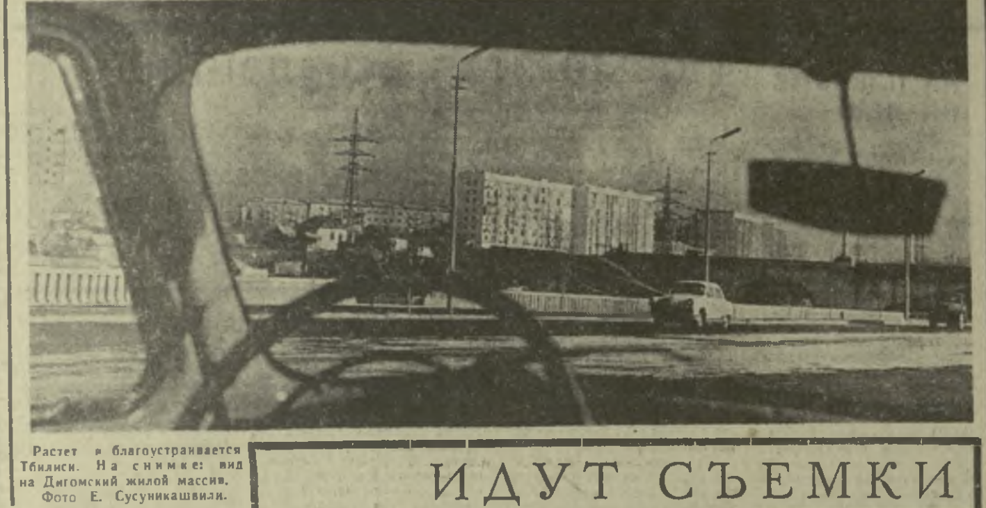
Растет и благоустраивается Тбилиси. На снимке: вид на Дигомский жилой массив.