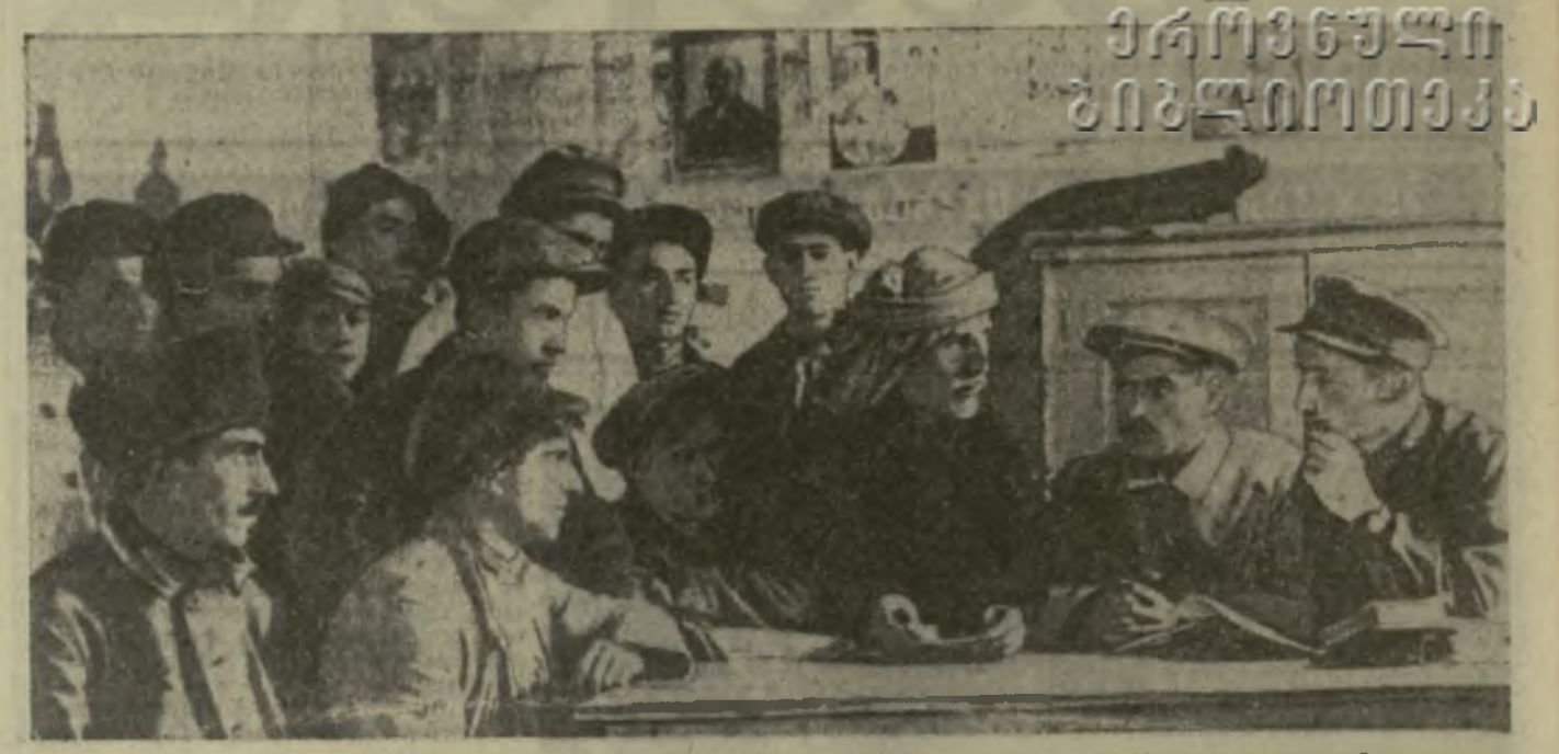
На снимке: общее собрание крестьян одного из сел Махарадзевского района в связи с организацией колхоза. 1930 г.

...СЕЙЧАС советская Грузия значительную часть своей жизни, она уселина новыми фабриками, заводами, гидроэлектростанциями, станциями районного значения, проведены новые оросительные каналы (Алазанский, Тиропонский, Машветский, Самурзаканский и др.). Начаты работы по осушению болот, в том числе величайшая работа по осушению колхидской низменности. ...ОБЩЕЕ благополучие рабочего класса и трудового крестьянства значительно улучшилось. В сельском хозяйстве происходит основной перелом по двум линиям: