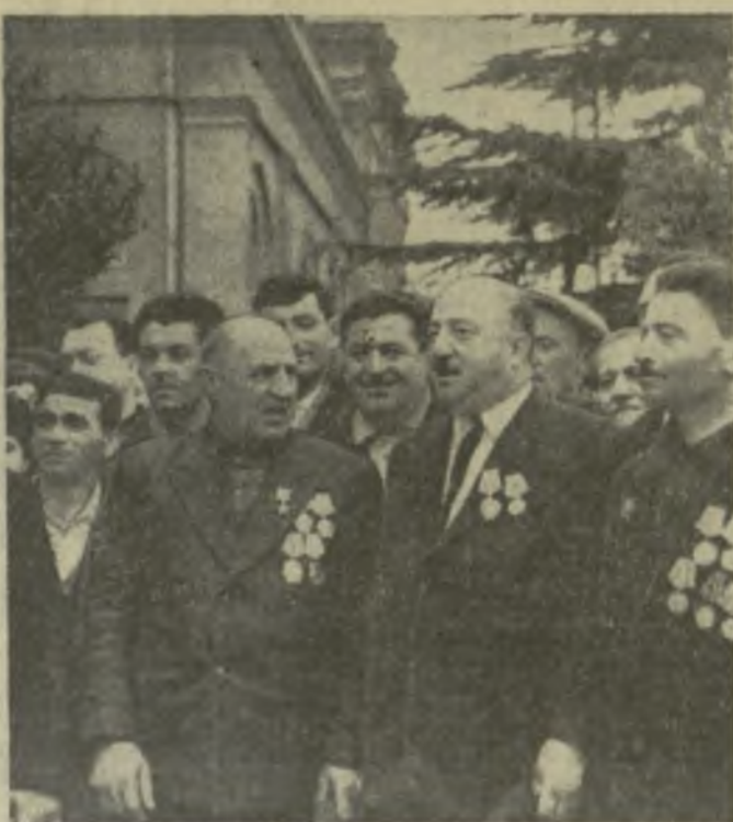
На снимке: гости из Ахалцихского района на перроне Тбилисского вокзала.