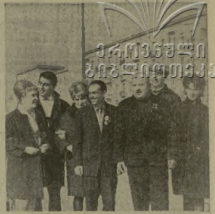
На снимках: (слева) — гости из Лагодехского района в Тбилиси. (Справа) — трудящиеся Гагрского района осматривают парк в Ваке.

Ко дню славного юбилея вступают в строй восемь школьных зданий, шесть детских садов, четыре клуба, Дом культуры, библиотека, амбулатория, объекты бытового обслуживания, спортивный зал. Претворяя в жизнь исторические решения XXIII съезда КПСС, лагодехцы уверенно строят свое будущее.