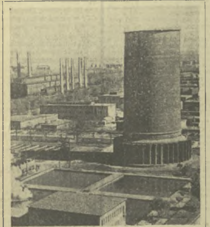
Создание конденсационной установки, в которой для охлаждения пара используется воздух, является одним из выдающихся достижений венгерской науки и техники.