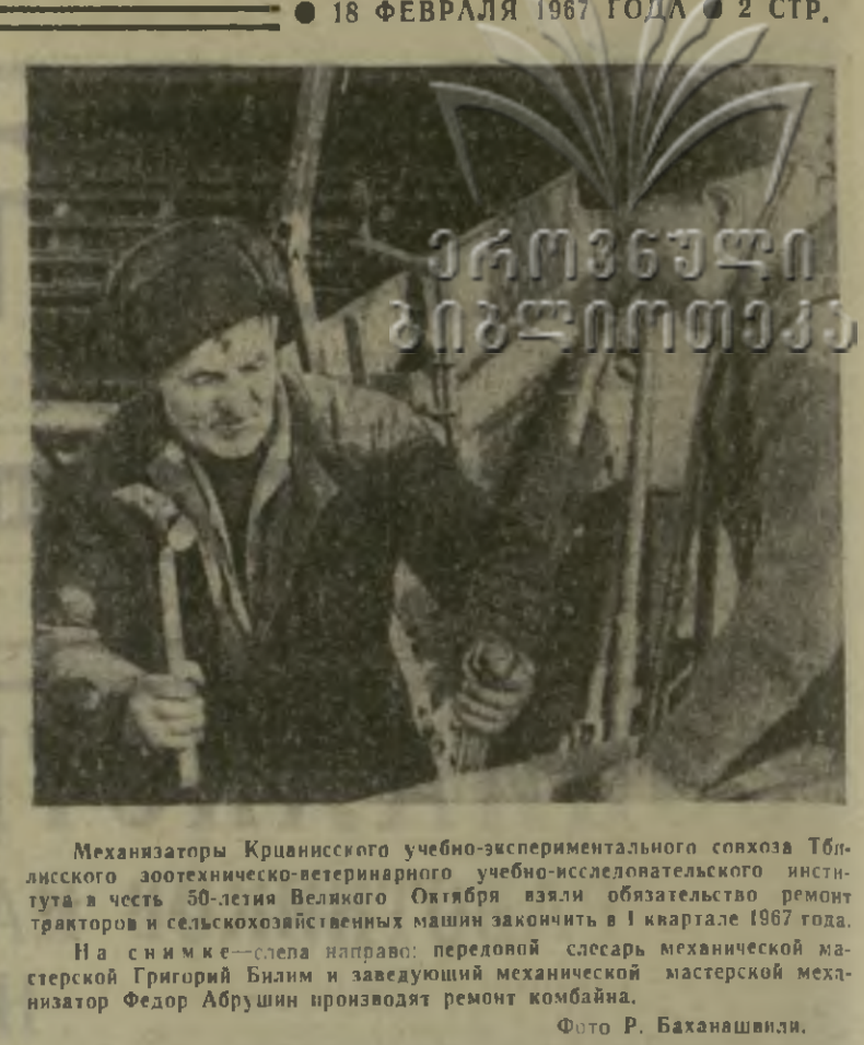
Механизаторы Красносельского учебно-экспериментального совхоза Тбилисского зоотехнико-ветеринарного учебно-исследовательского института в честь 50-летия Великого Октября взяли обязательство ремонт тракторов и сельскохозяйственных машин закончить в I квартале 1967 года.