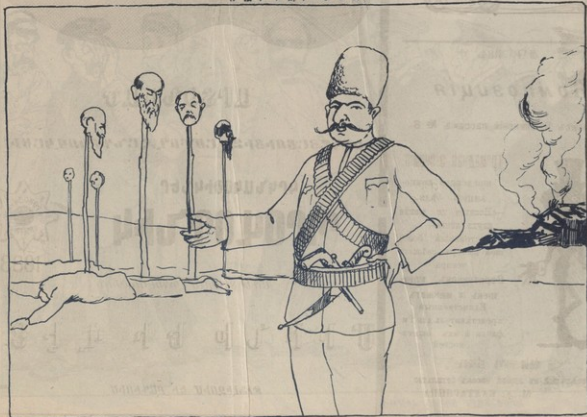
Այժմ Գարսեպատանու՛մ տանն քնէ հանդարտ է: