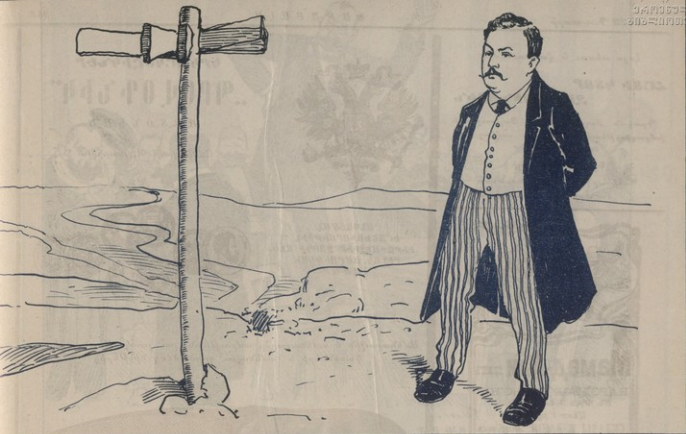
—Ո՛ր գնամ, երբ տյազէն խառնչփոխ է ուղիները և համոզումներնրս: