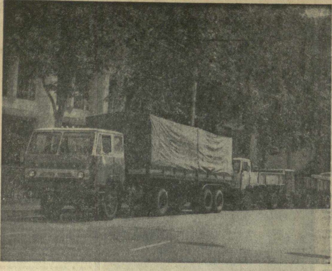
Автомобильному заводу им. Г. К. Орджоникидзе исполнилось 25 лет. Отличными трудовыми делами встречает свой юбилей прославленный коллектив. По итогам второго квартала автозавода в 16-й раз выданы победителям Всесоюзного социалистического соревнования. В эти дни, предшествующие юбилею, по инициативе комсомольской организации завода отправилась в путь по городам республики автоколонна, составленная из новой продукции кутаисских автостроителей — серийного тягача КАЗ-6088, экспериментального самосвала повышенной проходимости КАЗ-430 и полуприцепа КАЗ-430. Маршрут следования автоколонны пролегал через Тбилиси, Рустави, Батуми, Потли, Сукуми, Чхатура, Зестафони. В пути заводские комсомольцы — молодые рабочие, инженеры — встречались с коллективами ведущих предприятий республики. На снимке: колонна новых автомашин Кутаисского автозавода на улицах Тбилиси.