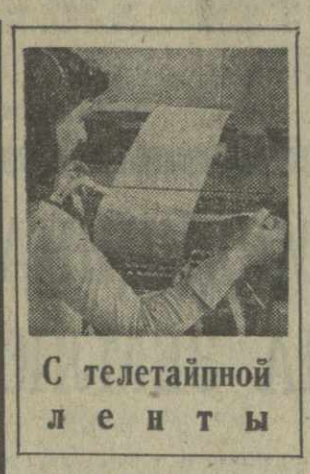
С телетайпной ленты

БОНН, 6 августа. (ТАСС). Под открытием антикоммунистическим и лозунгами неонацистскими готовится провести 7 августа в Гамбурге собрание, в котором, как объявлено, примут участие представители нефашистских партий ФРГ, Австрии, Франции, Бельгии, Великобритании и Норвегии. Всего ожидается около 1.800 «делегатов». Западногерманская НДП, как сообщает печать, арендовала для этой цели большую зал у фирмы «Гамбург-мессе» — вид конгресс-инженер по внутренним делам Гамбурга В. Штайн заявил, что для «защита этого мероприятия нет юридических оснований». Организации антифашистов и демократов ФРГ не согласны с такой позицией властей и решительно требуют запретить проведение слета. «Сейчас нельзя медлить, надо действовать!» — говорится в их обращении к населению города. Антифашисты призывают в ответ на проносы правых организовать 7 августа массовую демонстрацию.