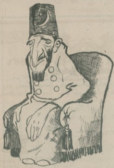
Իսկապես ասելի չու էր ինձ, թողնալուսանքեանց պարտանք, զան իմ կոչումը լինելը: Գտնել այս օրինակ սուրբանոց չէի ուստի: