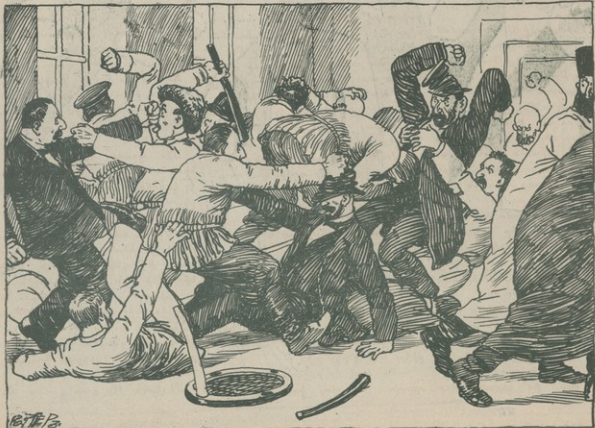
Միակամները բանձնալսյուս կամ բանձնայ են ընտրում՝ սուր ու զեփոցով.