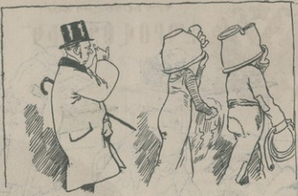
Անհրժեշտ ճաղա, շնա փոխանում, իմ արանցից մի ասելի գեղեցիկ է: