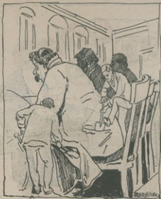
Մեր շատ գործիչները գրգռանում են, մշտնջենքով կայծեր է հասարակական ակիբներ գառնել, մի՞տ քրքրելից սալ, ձեռք խաղաղութեան ներթափանցող արանց գործունեությունն ու գրգռանները: