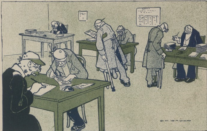
Ահա ի՛նչու կրիտի քայլերով է առաջ գնում 'Հարսրազի մաշրափաղարի գործերը':