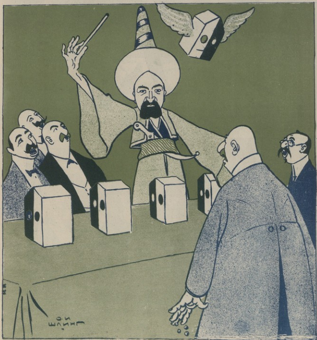
ՄՈՐԱԿԱՆ ԱՆԵՐԵՆՈՅՔԱՆՈՒՄԸ ԸՆՏՐՈՂԱԿԱՆ ՔԻՆՏՈՒՓ

Քիֆիկի Ասեղաբանի բանկում. Փանդոյեանի քաղաքի յանկարձ անհետացաւ: 26րդ տասն միջոցները՝ խաղարկութիւնն ու ջնուութիւնը-իզուր սնցան: