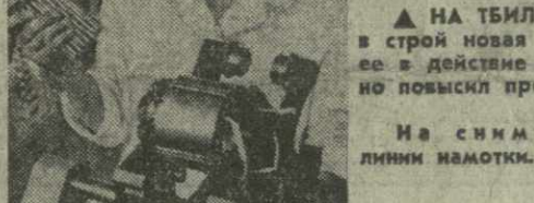
▲ НА ТБИЛИССКОМ ЗАВОДЕ «МИКРОДВИГАТЕЛЬ» вступила в строй новая линия намотки статора электродвигателей. Ввод ее в действие позволил выводить пять рабочих, значительно повысить производительность и качество труда.