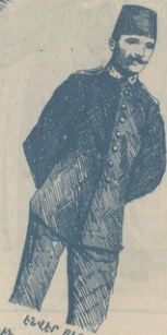
ԵՆՁԵՐ ԲԵՅ (Համբեր անձամբ կալանաւորաց)