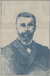
ԱՎԵՏԻ ՐԻԶԱ ԲԵՅ Նախագահ պարզամեծարի և երես. Թիւրքերի կոմիտէի շէֆ