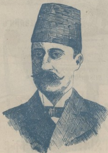
ԳԱՀԱԺԱՌԱՆԳ ԳՐԻՆՑ ԻՒՍՈՒՅ ԻԶԵԴԻՆ

Ճար Սուլթանի սակէ թախտը շարդանցաւ, վար ընկաւ, թախտի տակէն ըիւր ժարդկերանց ազա- տութիւն ծագեցաւ: