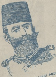
ՄԱՄՈՒՅ ՇԵՎԿԵՏ ՓԱՆԱ (Սալոնիկի զօրքերի նրամանատար և զինատար)