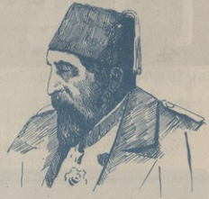
ԳԱՆԱՎԵԹ ԵՂԱՅ ԱՐԳԻՆ-ՀԱՄԻՐԻ (Հայերի բարեկամ)