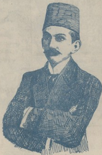
ԳՐԻՆՑ ՍԱԲԱՆ-ԷԴԻՆ անբարեբեք պարագլուխ