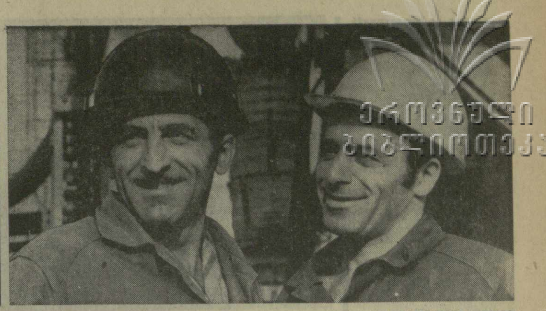
▲ БАТУМСКИЕ ПОРТОВИКИ досрочно выполнили полугодовой план по грузопереработке. Здесь широко подвигаются почти докеров Ильичевского морского порта по комплексной обработке судов. Это позволило батумским докерам добиться высоких результатов. Все суда, приходящие в Батумский морской порт с грузом, обрабатываются досрочно.

№ 169 (15536) • СРЕДА, 21 ИЮЛЯ 1976 ГОДА • Цена 2 коп.