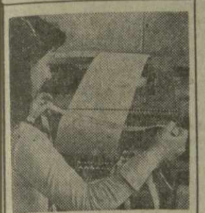
С телетайпной ленты

▲ ПАРИЖ. Правительство Гринеда и Тобаго, островного государства в Карибском море, информировало США, Японию и ряд латиноамериканских стран о своем отказе участвовать в предстоящих совместных военно-морских учениях. В официальном заявлении говорится, что в связи с предстоящим в сентябре всеобщим