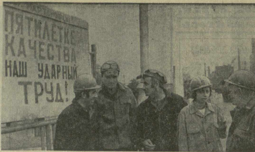
«ЗАВОДОМ СОРОКА БРАТЬЕВ» называют Руставский металлургический завод — флагман черной металлургии Закавказья. Люди сорока национальностей плечом к плечу дружно трудятся в многотракторном цехе...