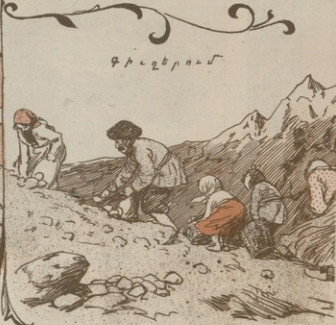
Գ Ի Լ Չ Ե Ր ՈՒ Մ