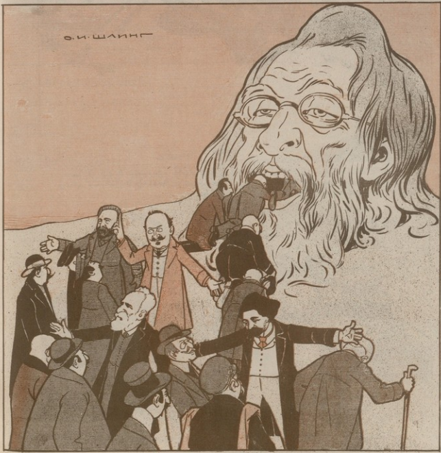
ՀԱՅԵՐՍ ԿՈՒՆ ԵՆՔ ԳՆՈՒՄ...