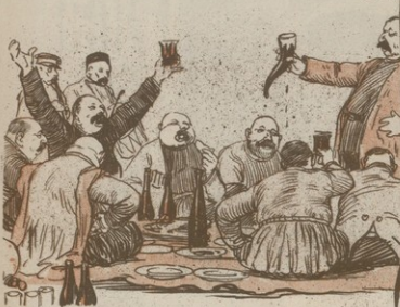
« Ա Ղ Ա Ն Ե Ր Ա Ն Է »