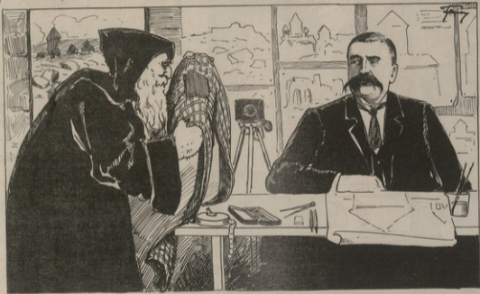
ՀԱՐՏԱՐԱԳՈՅ ԲՈՐԱՄԱՆԵՐԸ ԻՆ ՓԻՐԱՆԻ ՀԱՐՏԱՐՈՅԸ

Միջ. վարդապետ.—Գ. հարտարպետ, հայ հա- ռաւանքը, ինտելիցենցիան և քանազանները որոշ վարկույթ են ցո արած զիտական աշխատութիւննե- րով. չկարողանալով ներթափել սրնէ, ուղար- կած են ընդ իրենց կն յարեց, որպէս ի կարող լինել էլ աւել տեղու աշխատել: