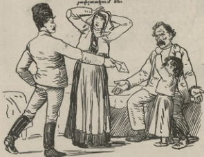
...Ար գործը չէ, որ գու. հոգի փոյ չունեն. երբ այս համակի համանախ մեզ փոյ չուտա, անպատեալ ե. ըրեալից կը փախչենք: