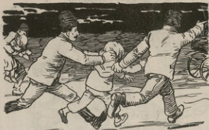
Փոյ կորցելու համար փախչողներու իրերաներն յախշտակու՛մ են: