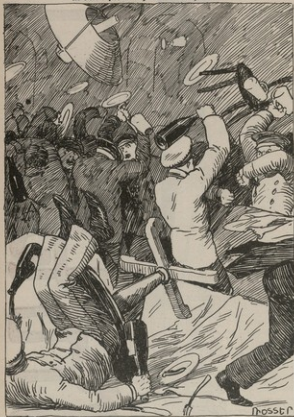
GAUDE HAMUS իրարը ԱՅն ա. բաժնի վերջուր: