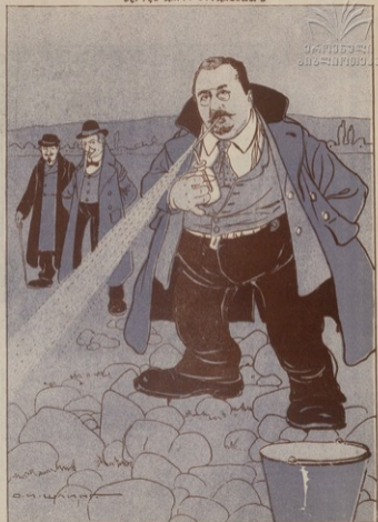
ՅՈՒՐԻՆ ԳՐԱՆԻՆ ԵՎ ՄԵՆԵՑ ԿՈՐԵՆԿՎ ՎՈՐԱՆԻՆՆԵՐՆԵՐ ԵՎ ԱՐԵՆԻՆԻՆԻ, ԵՄՔԱՆՆԻ