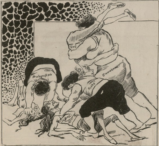
Ինչպե՞ս կարող է լինել այդպիսի դժբախտություն հայկական տանը: Ինչպե՞ս կարող է լինել այդպիսի դժբախտություն հայկական տանը: Ինչպե՞ս կարող է լինել այդպիսի դժբախտություն հայկական տանը: