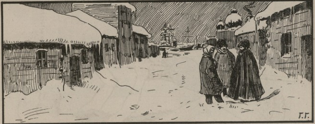
Ավաճայ և ձեռագրեր