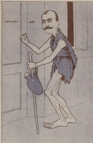
ԳՐԱԿԻՆ ԱՓՈՒՐԸ, ՄԵՆԵՑ ԿՈՐԵՆԿՎ ՎՈՐԱՆԻՆՆԵՐՆԵՐ ԵՎ ԱՐԵՆԻՆԻՆԻ, ԵՄՔԱՆՆԻ