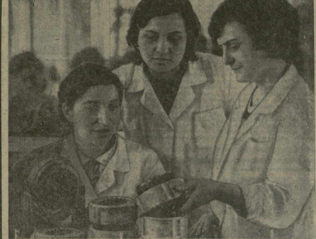
На головном предприятии тбилисского производственного объединения «Грузэлектромаш» завода «Микродиеталь» широко развернуто движение за отличную дисциплину и высокую культуру производства. В него включились все члены коллектива.