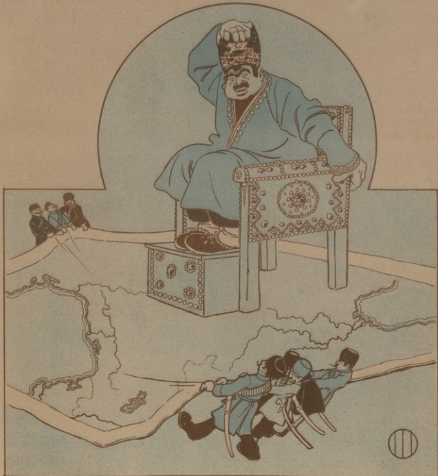
Չրո՞րդ: Արտ. Տ. Բուչիկովա, Թոմոս.