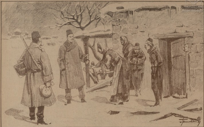
ՆԳԱՍՏՆԵՐԻ ԲԱՆԵՈՒՄԸ ՍՈՎՃԱՆՆԵՐԻՆ