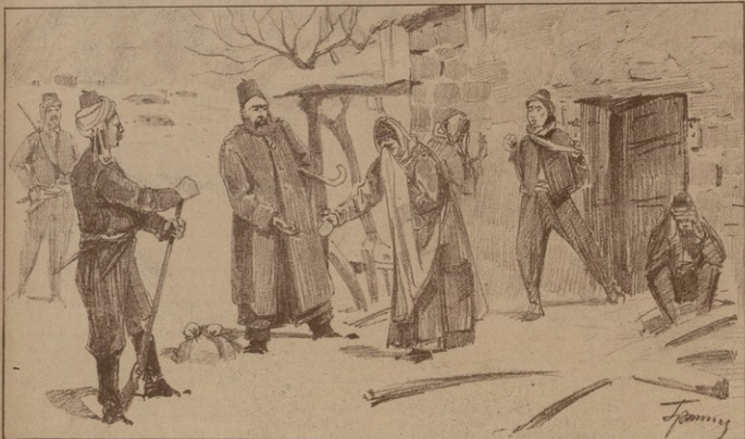
ՆՈՏ ՆԳԱՍՏՆԵՐԻ ԳԱՆՁՈՒՄԸ ԵՒ ՆՈՏ ՍՈՎՃԱՆՆԵՐԻՆ ԳՅՏԱԿԱՆ ՏՈՒՐԻՆԻ ՆԱՄԱՐ