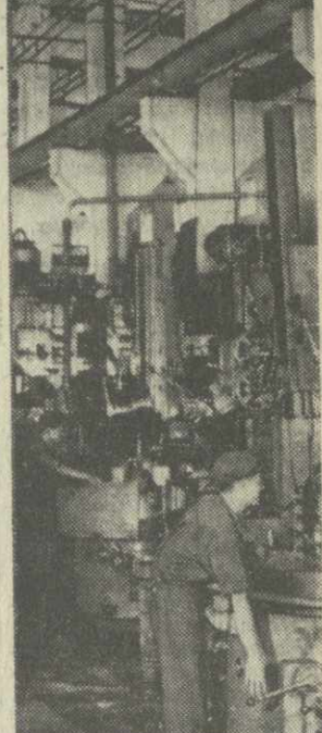
На снимке: здесь изготавливается продукция с маркой «Сделано в социалистическом Вьетнаме».

С помощью СЭВ. Все страны — члены СЭВ оказывают огромную помощь в развитии и становлении промышленности острова Свободы.