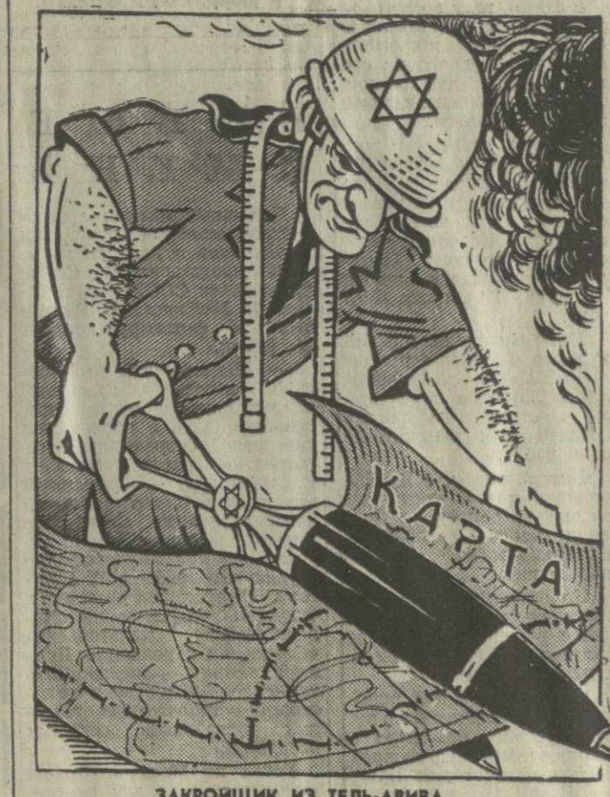
ЗАКРОЙЩИК ИЗ ТЕЛЬ-АВИВА.

Более того, в ходе недавних американо-израильских переговоров правительство США открыто поддержало требование Тель-Авива об обеспечении ему так называемых «этичных границ», которыми Израиль прикрывает свой отказ возвратить захваченные арабские земли.