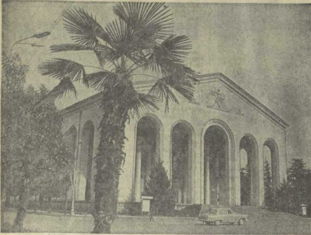
▲ МАХАРАДЗЕ СЕГОДНЯ. На снимке: здание драматического театра.