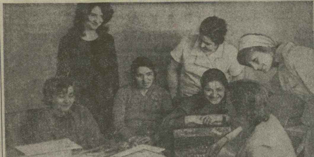
▲ НА ГОРИСКОМ ХЛОПЧАТОБУМАЖНОМ КОМБИНАТЕ большое внимание уделяется организации труда и отдыха работников. Вопросы эти находятся под постоянным вниманием администрации и профсоюзной организации. В красном уголке комбината, где собираются товарищи по труду, не умолкает смех, песня, Отдохнув и набравшись сил, работники с удвоенной энергией приступают к работе.