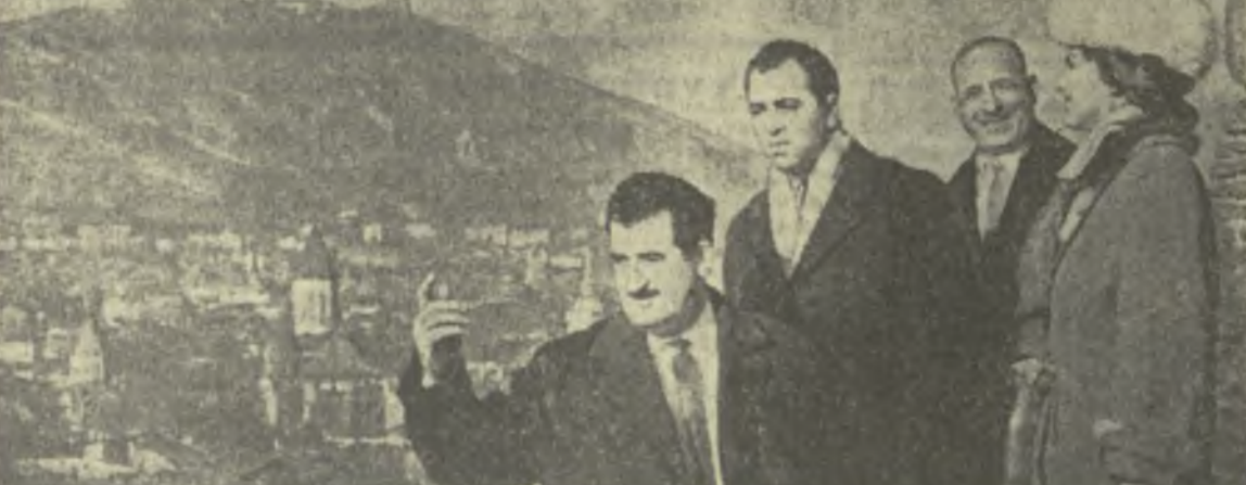
Величественная панорама города развернулась перед гостями из Цхалтубского района.