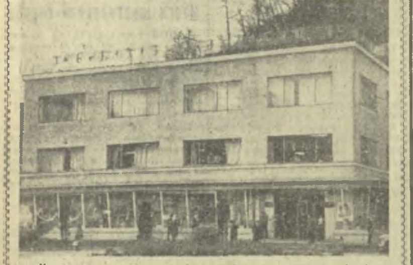
На снимке: здание нового универсального магазина в Ткибули.

● Трудники предприятий и учреждений города Хашури решили создать в честь 50-летия Великого Октября на горе Земосери лесопарк. К главному юбилею будет завершено строительство автомобильной дороги, ресторана и других объектов.