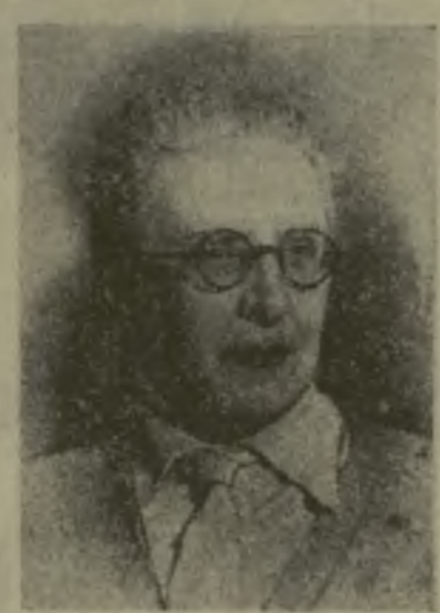
Портрет Елены Дмитриевны Стасовой