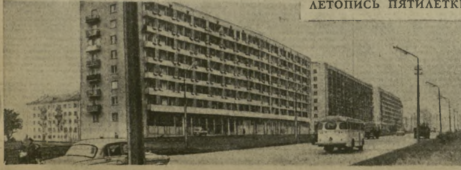
На снимке: новый жилой квартал в Дигомском массиве.