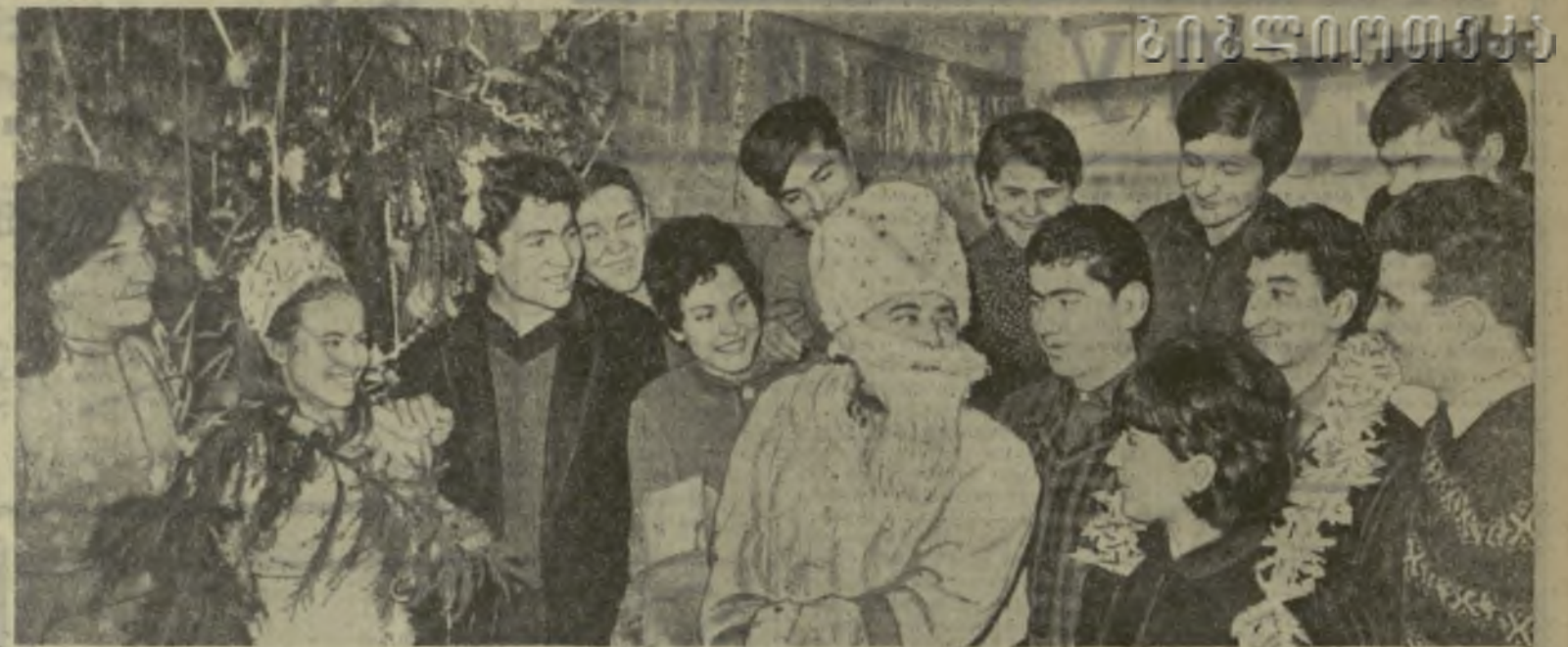
Весело провели свой новогодний вечер учащиеся Тбилисского профтехучилища № 27. Самодеятельные художественные коллективы выступили с праздничной программой: молодежь состязалась на лучшее исполнение песни, танца. Дед-Мороз явился на вечер с подарками для всех...

И девушек ты вспомни, Новый год, Пусть расцветают с каждым днем все краше... Да будет с счастьем светлый твой приход! Да будет с счастьем эта встреча наша!