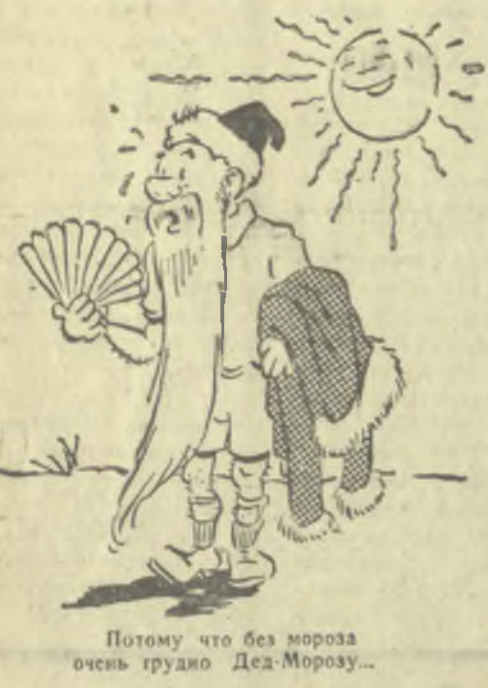
Потому что без мороза очень трудно Деду Морозу...