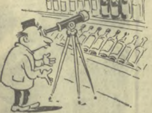
Астроном в гастрономе (безуспешные поиски «трех звездочек»)