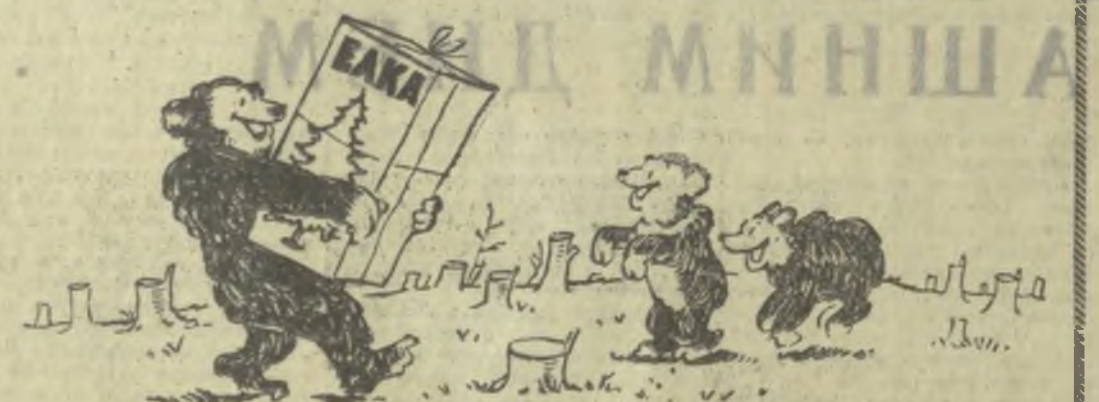
Вот и у нас будет елочка... Рис. А. Канделак.