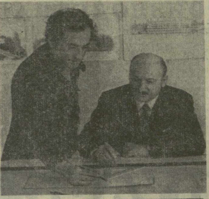
Чемпион мира Анатолий Карпов.

Вот бронзовый меч, обнарожденный неподалеку от древней крепости. После тщательного его исследования учитель пришел к выводу, что меч принадлежал воину римского полководца Помпея, который в 66 году до нашей эры выступил против Кахети.