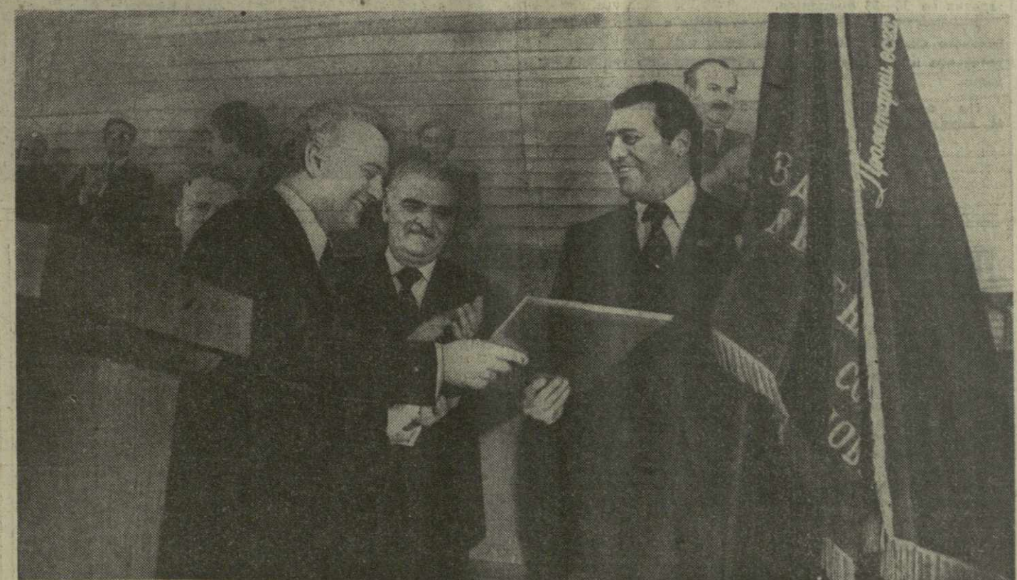
На снимке: во время вручения награды.