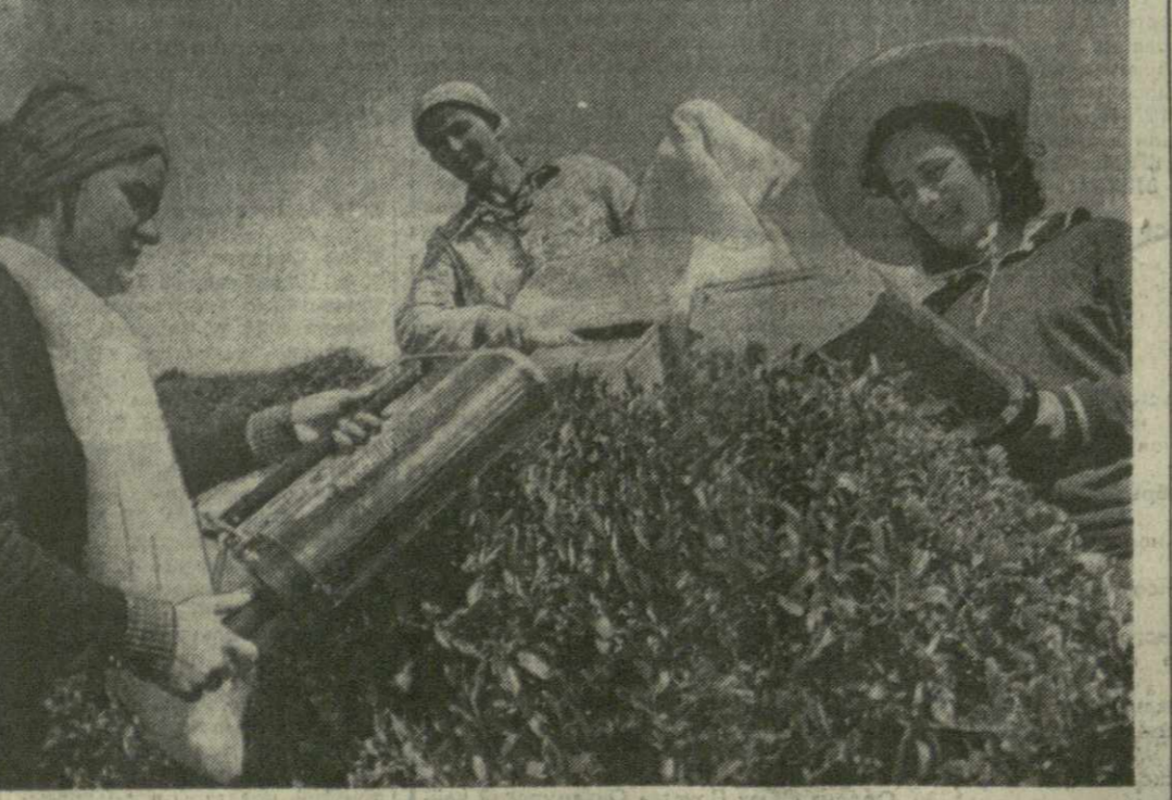
▲ НА ЧАЙНЫХ ПЛАНТАЦИЯХ РЕСПУБЛИКИ все шире находят применение малая механизация. Ручные аппараты стали надежными помощниками чаеводов. Среди пионеров этого важного дела — труженики Хечерского чайного совхоза Зугдидского района. Местные чаеводы успешно выполняли задание первого года десятилетия и ныне готовятся достойно встретить юбилей Октября.

● В минувшем году темп роста товарооборота в торговле составил 1,4 процента при плановом задании 3,7 процента. Сверх плана продано товаров на 47 миллионов рублей.