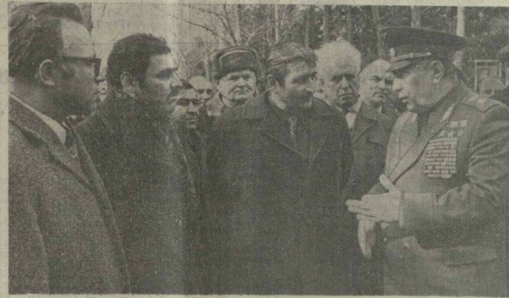
На снимке: председатель ЦК ДОСААФ СССР маршал авиации трижды Герой Советского Союза А. И. Покрышкин беседует с рабочими Тбилисского электровозостроительного завода имени В. И. Ленина.