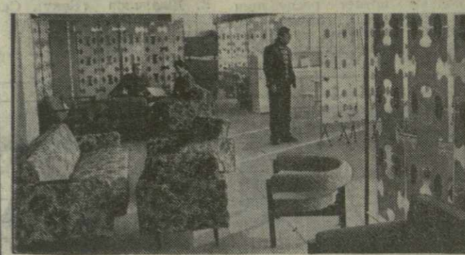
На снимках: сверху — здание молодежного кафе и ресторана в новом торговом центре поселка Вани. Внизу — интерьер «Дома мебели».