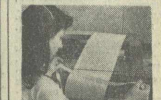
С ТЕЛЕТАПИНОЙ ЛЕНТЫ

Горизонты советско-испан- ского сотрудничества будут все шириться и укрепляться. Т. ГАМКРЕЛИДЗЕ, обозреватель «Заря Востока».