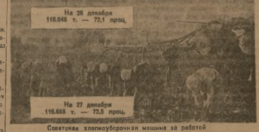
Советская хлопкоуборочная машина за работой

Вместе с тем, благодаря хлопководческому соревнованию, которое развернулось в Агджабединском районе, хлопководы добились успехов в выполнении плана хлопкоуборочной работы на 101 проц. Сано на государственные пункты 5798 центов хлопка-сырца.