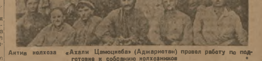
Антиколхоз «Ахали Цамотцеба» (Аджаристан) провел работу по подготовке и собранию колхозников