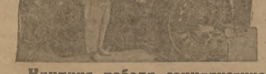
Генератор 2-й Эрэгс