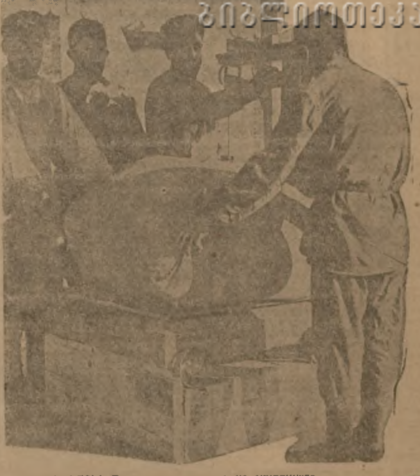
НАРАЯЗЫ. Везение хлопка на скупунктах.

СМЕЛЕЕ ВНЕДРЯТЬ СОЦИАЛИСТИЧЕСКИЕ МЕТОДЫ ТРУДА НА ХЛОПКОВОМ ФРОНТЕ ДОСРОЧНО ВЫПОЛНИТЬ ГОДОВОЙ ПЛАН