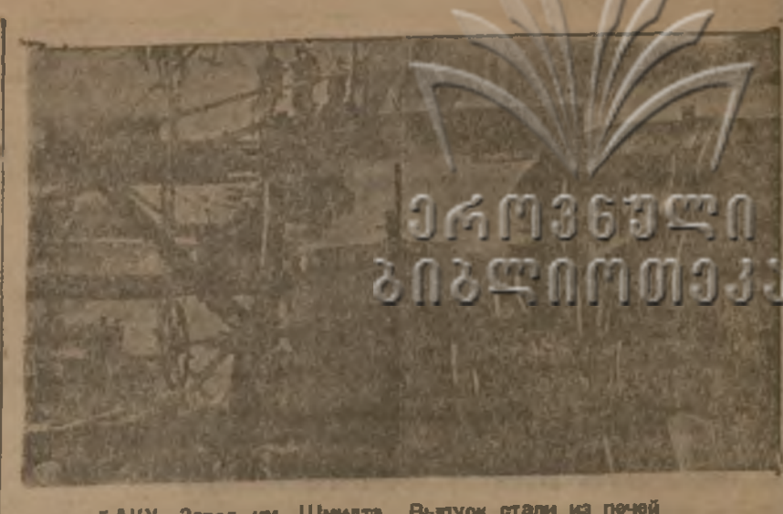
Бану, завод им. Шамхата. Выпуск стали из печи