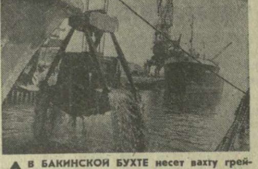
▲ В БАКИНСКОЙ БУХТЕ несет вахту рейфверный эсминец «Аракс». Он предназначен для углубления дна непосредственно у причалов. Все работы на «Араксе» автоматизированы и механизированы.

Новая продукция подготовлена к отправке заказчиком — серпуховскому заводу «Гидростройдеталь» и заводу железобетонных изделий в городе Энгельсе. В первом году десятой пятилетки бакинцы изготовят для мелнораторов страны более 70 таких форм.