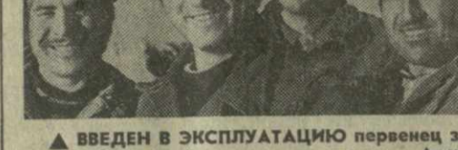
▲ ВВЕДЕН В ЭКСПЛУАТАЦИЮ переносной золотодобывающей промышленности Армении — Зодский горно-обогатительный комбинат.

Армения постоянно привлекает к себе множество отдыхающих. У берегов лазурного озера Севан, среди гор, где раскинулись здравницы Дилджана и Джермука, к числу действующих к концу года прибавятся еще три туристических базы.